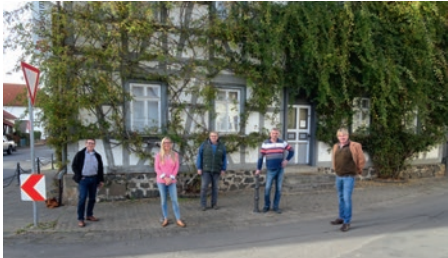
Erneuerung Fenster Vereinstreff und Rosenmuseum