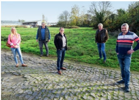
Parkplatz an der Turnhalle

Im Ortsbeirat – in der Stadt – im Wetteraukreis